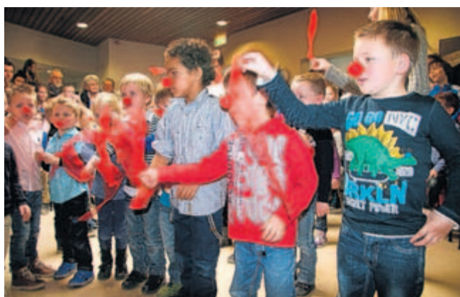
De kleuters van basisschool De Notenbalk zijn tijdens het kunstproject volop in aanraking met kunst gekomen.